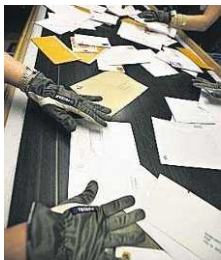
NYA RUTINER. Medarbetare på Postens terminaler ska bestämma mer hur jobbet ska göras.