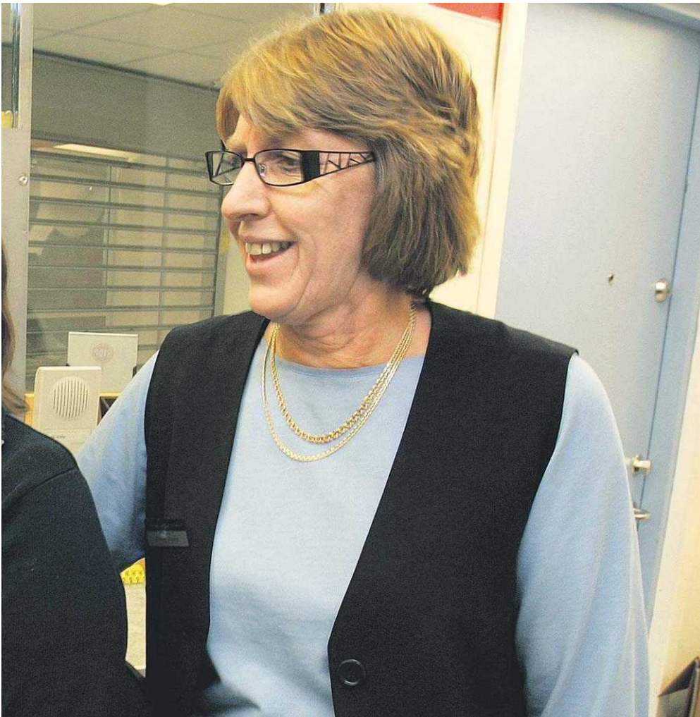
på Svensk Kassaservice i Gällivare.

■ Att vara vd är det yrke som sliter minst på kvinnor. Det visar en studie från en forskare från nedlagda Arbetslivsinstitutet, enligt Du & jobbet. Förutsatt att man stannar inom samma yrke förlorar kvinnor minst antal år i sitt yrkesverksamma liv genom förtidspension eller för tidig död som vd eller verkschef, 0,6 år. Män förlorar minst antal år som specialister inom jord- och skogsbruk, 0,4 år. (DI)